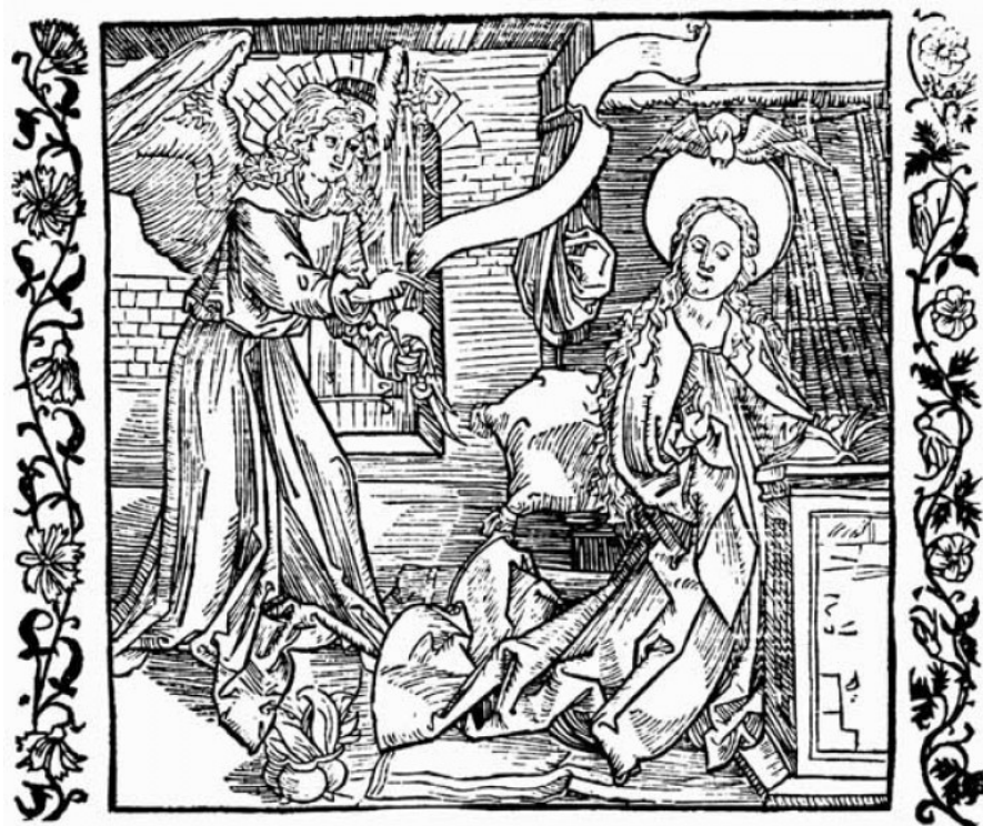
Albrecht Dürer „Verkündigung“